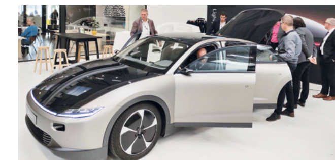
Véhicule solaire développé par l'entreprise LightYear.

Le cluster européen EACN a été fondé cette année par plusieurs entités, dont l'ARIA Hauts-de-France. Existant déjà précédemment sous la forme d'un projet, ce réseau rassemble 21 clusters automobiles du continent et a été officiellement constitué en janvier 2021 en association. Coordination des informations en période de crise sanitaire et économique, participation à des interventions en lien avec des structures européennes, réalisation de cartographies conjointes, diffusion de lettres d'information... les sujets ont été nombreux pour les partenaires d'EACN, présidé par le pôle Véhicule du futur.