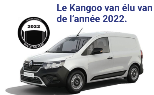
Le Kangoo van élu van de l'année 2022.