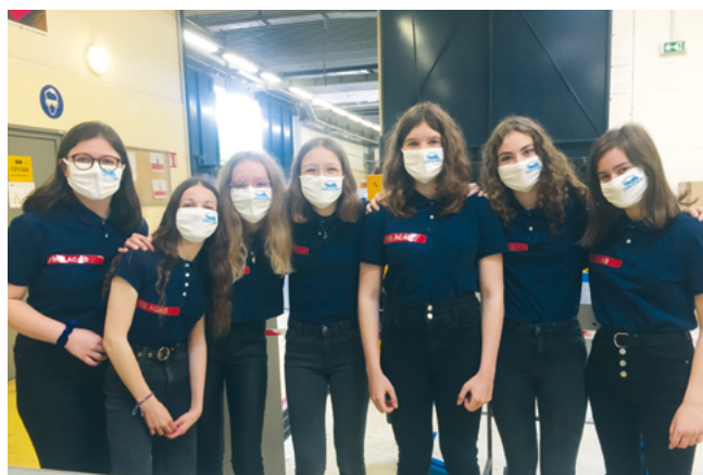
L'équipe FIRE ACAD.