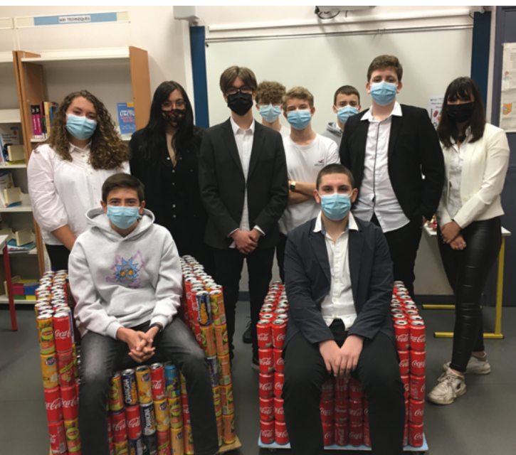
Stud'easy et Kan ont tous été récompensés lors de l'événement de clôture.

L'ARIA Hauts-de-France est partie prenante dans le projet "Entreprendre en Hauts-de-France" piloté par Dreamakers. Au cours d'une année scolaire, deux groupes d'étudiants sont accompagnés par l'association. Ils ont pour objectif de concevoir un produit et de le commercialiser, le tout dans un esprit entrepreneurial.