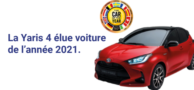
La Yaris 4 élue voiture de l'année 2021.